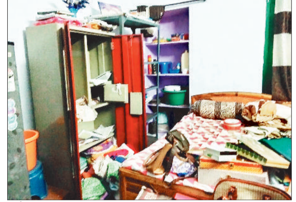
चोरी के बाद बिखरा सामान।