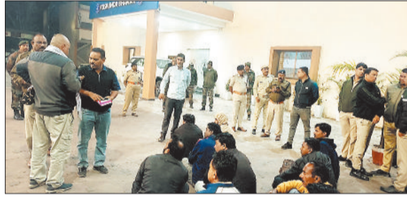
घेराव करते भूविस्थापित।

एसईसीएल के सीएमडी कोयला उत्पादन बढ़ाने के लिए कुसमुंडा क्षेत्र के दौरे पर रविवार की शाम पहुंचे और लगभग 7 बजे रात के समय कुसमुंडा गेस्ट हाउस में अधिकारियों से चर्चा कर रहे थे। इसकी जानकारी होते ही भूविस्थापितों ने बड़ी संख्या में किसान सभा और भूविस्थापित