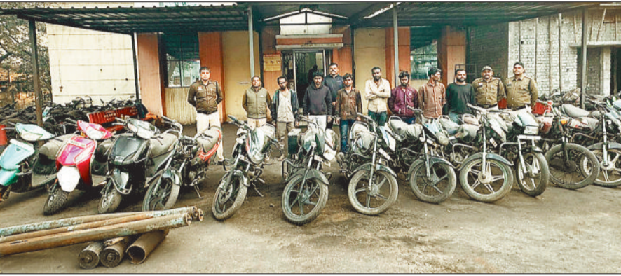
पुलिस गिरफ्त में आरोपी एवं जब्त मोटरसाइकिल।