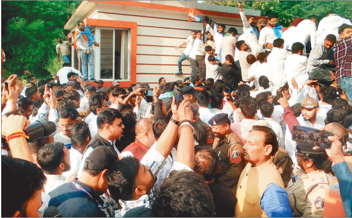
सेंट्रल यूनिवर्सिटी के गेट के ऊपर चढ़कर अंदर जाने का प्रयास करते कार्यकर्ता।