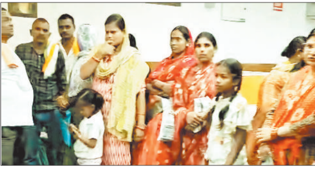
कोनी स्थित जर्जर अटल आवास में शिफ्ट होने से इनकार करती महिलाएं।

ज्ञात हो कि तीन महीने पहले शिवचाट बैराज में अचानक पानी भर गया था। दरअसल सिंचाई विभाग ने पानी का बहाव और बैराज में इसकी टेस्टिंग के लिए ट्रायल किया था। इस दौरान अरपा के तटवर्ती कुदूदंड क्षेत्र की महिला नंबर 1, 2, 3 और 4 के 20 से अधिक घरों में पानी भर गया था। पिछले